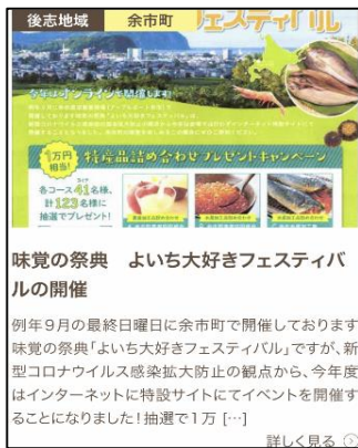
【イベントの告知の例】

現在募集中の「 イベントの告知 」や「 モニター募集 」など軽いものから、「 地域活動への参画募集 」など、様々な形で地域と「ツナガル・カカワル」きっかけとなる情報を掲載！！