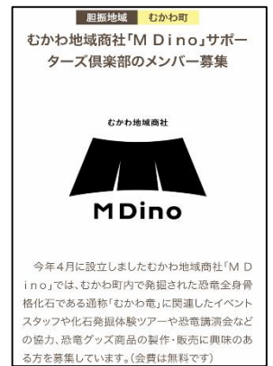
【地域活動への参画募集の例】