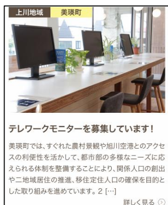
【モニター募集の例】