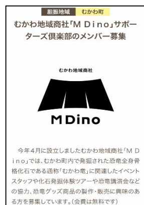
【地域活動への参画募集の例】