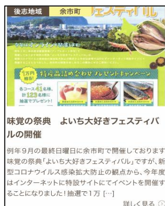
【イベントの告知の例】

「 イベントの告知 」や「 モニター募集 」など軽いものから、「 地域活動への参画募集 」など、様々な形で地域と「ツナガル・カカワル」きっかけとなる情報を掲載!!